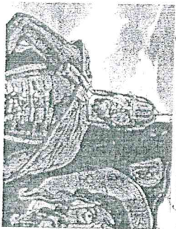
б) Александр Невский;